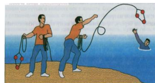
Подача конца Александрова

Конец Александрова нужно взять за большую петлю и сделать 2-3 витка веревки, малую петлю и оставшуюся веревку следует удерживать в другой руке. Сделав несколько замахов рукой с большой петлей, бросают конец Александрова пострадавшему; тот в свою очередь должен надеть петлю через голову под руки или держать за поплавки. После этого пострадавшего подтягивают к берегу.